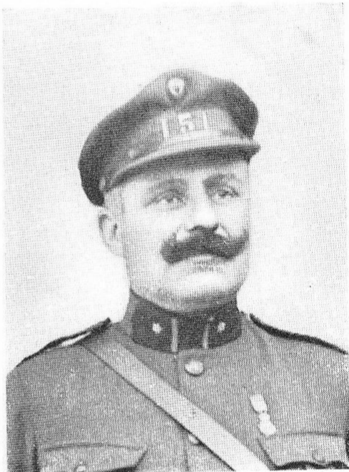
PHILIPPOT, Victor , né le 17 octobre 1869, à Anvers. Major. Off. Ordre de Léopold; Ordre de la Couronne; Croix de Guerre; Croix Militaire 2 e classe. Se distingua au cours de la guerre, en accomplissant des missions périlleuses, et tomba frappé de trois balles de mitrailleuses, à Sommerghem, le 21 octobre 1918.