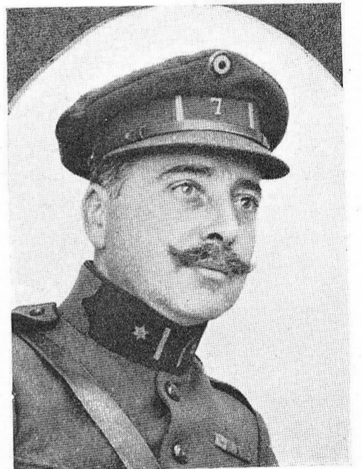
VAN DE MOORTELO, François-Odilhon , né le 28 août 1874, à Lebbeke. Major. Off. Ordre de Léopold; Croix de Guerre; Croix Militaire 2 e classe. Blessé une première fois à Wygmael, le 12 sept. 1914, tomba frappé d'une balle en pleine poitrine, alors qu'il encourageait ses hommes à se porter à l'attaque, à Moorslede, le 29 septembre 1918.