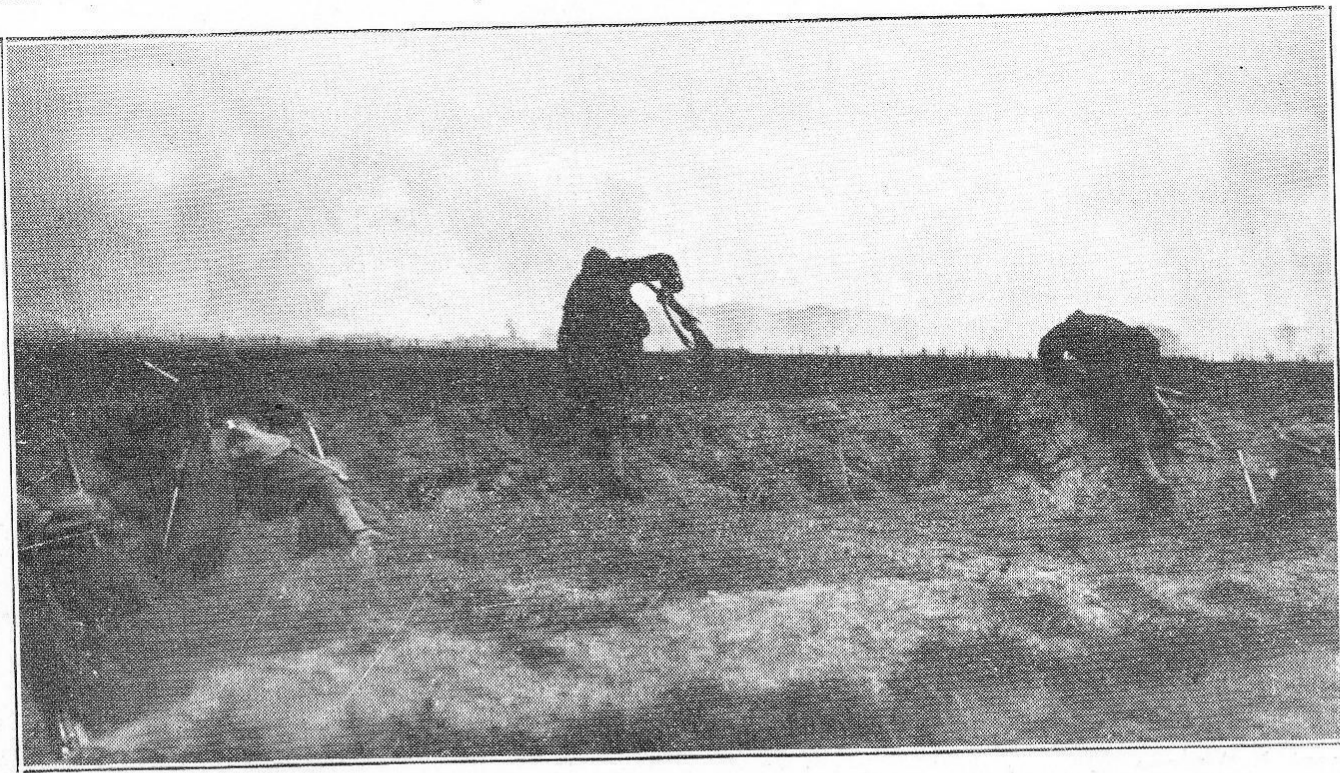
Sortie des tranchées pour l'attaque.