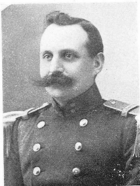
DEFER, Edgar , né le 17 juin 1871, à Jumet. Capitaine-Commandant. Ordre de Léopold; Croix de Guerre; Croix Militaire 2 e classe. Après la retraite d'Anvers, prit une part active aux opérations de défense sur l'Yser, et tomba au Champ d'Honneur, le 4 nov. 1914, à Lombartzyde.